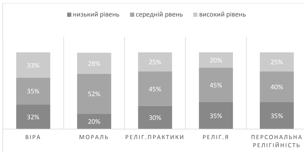
Рис. 1 Порівняльна діаграма результатів, отриманих за підшкалами «Шкали персональної релігійності»Р. Яворського ( у %)

Отримані за методикою «Шкала персональної релігійності» Р. Яворського результати відображені в діаграмі на рис 1.