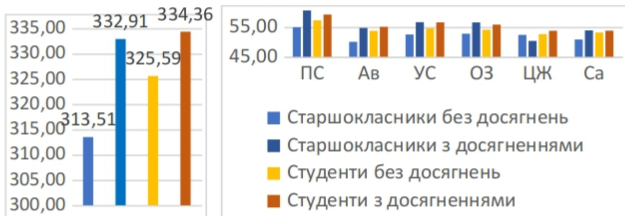
Рисунок 2. Індекси і показники субшкाल психологічного добробуту старшокласників і студентів залежно від досягнень

Подібне співвідношення показників спостерігається і щодо складників психологічного добробуту. Виняток становить лише субшкала ЦЖ (цілі в житті), за якою старшокласники з досягненнями показали нижчі значення. Ймовірно, це може бути проявом переоцінки цінностей обдарованими старшокласниками під впливом соціального оточення і початок процесу інволюції обдарованості. І через різницю у віці, і через те, що на відміну від студентів вони ще повністю не визначилися з вибором професії, обдаровані старшокласники більшою мірою піддаються впливам ціннісно відмінного оточення. Власне, це ж можна віднести й до тих старшокласників і студентів, які не мають значних досягнень у сфері розвитку здібностей.