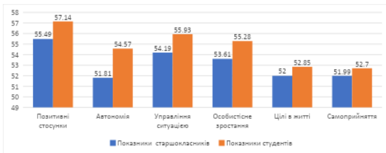
Рисунок 1. Показники субшкал психологічного добробуту досліджуваних

Інтерпретувати ці розбіжності без додаткових досліджень доволі складно, але все ж можна зробити декілька припущень. Студенти вже зробили свій життєвий вибір, обравши майбутню професію і шлях реалізації своїх життєвих проєктів. Що стосується старшокласників, то, очевидно, хвилювання, пов'язані