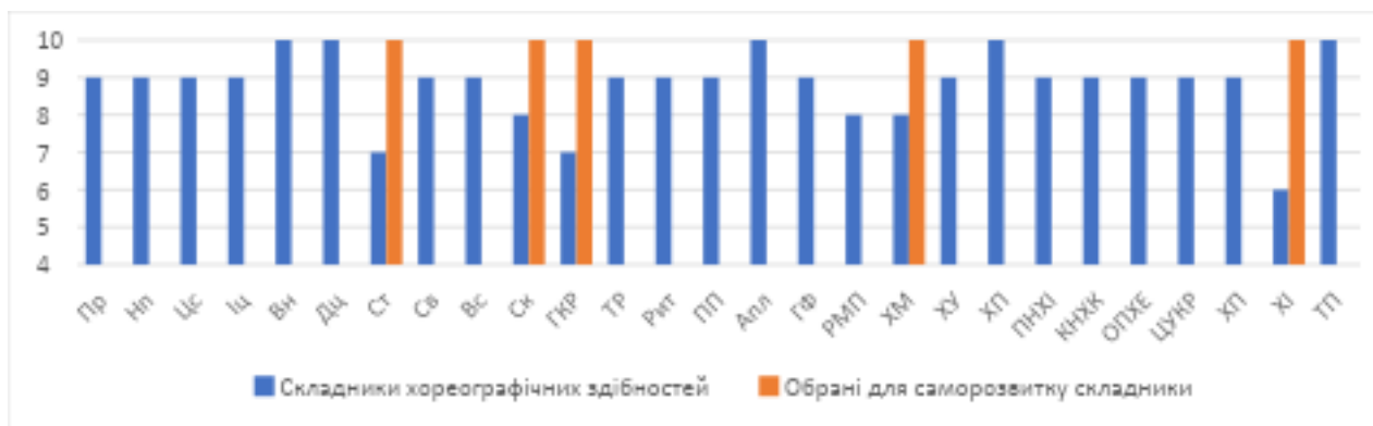
Рис.3. Рефлексійна самооцінка студентом В. власних хореографічних здібностей

У студентів, які тривалий час займаються танцями, вже сформувалася картина власних хореографічних здібностей, у якій не всі компоненти виражені однаково. Студент В. не планує розвивати одразу всі складники здібностей, а зосереджується на кількох: старанність, самоконтроль, гармонійна координація рухів, хореографічне мислення, хореографічна імпровізація. Зрозуміло, що це ті компоненти хореографічних здібностей, які, як він відчуває, по-перше, можуть бути розвиненими, а, по-друге, підтягнуть за собою всі інші. Така стратегія саморозвитку видається досить ефективною, особливо у випадку, коли вона підкріплюється деталізованим планом із конкретизацією вправ і контролем результатів.