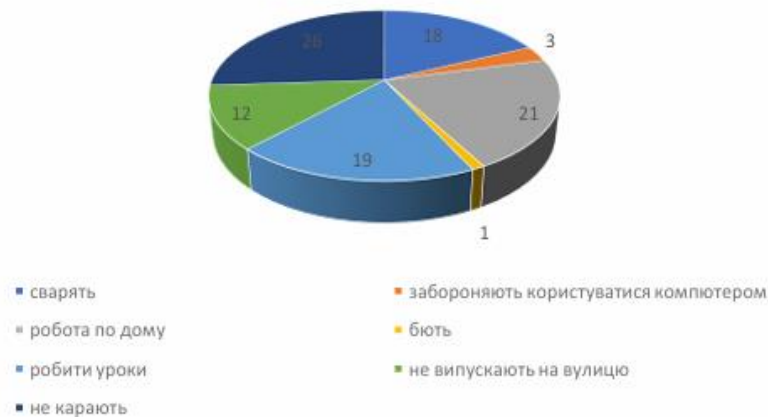
Рис.6.Результати опитування шестирічних-першокласників (дівчаток) з питання «Засоби покарання?» у % від загальної кількості досліджуваних

Батьки повинні пам'ятати про те, що більше схильні до страхів діти, яких дорослі часто сваряться. Дитина відчуває себе безпорадною, а часто і винуватою. Саме почуття безпорадності та провини дуже часто перероджуються в почуття страху. На початкових етапах навчання дитини у школі надзвичайно важливі довірливі відносини з близькими рідними та відсутність конфлікту.