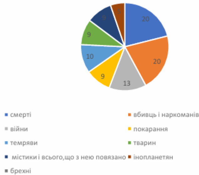
Рис.2. Результати опитування шестирічних-першокласників (дівчаток) з питання «Найбільше я боюся...» у % від загальної кількості досліджуваних