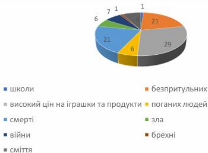
Рис. 8. Результати опитування шестирічних-першокласників (дівчаток) з питання «Хочу, щоб на світі не було...?» у % від загальної кількості досліджуваних