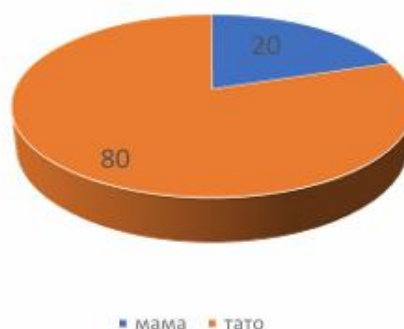
Рис.4.Результати опитування шестирічних-першокласників (дівчаток) з питання «За провину дістається?» у % від загальної кількості досліджуваних

Близькі рідні повинні пам'ятати про те, що дитина шестирічного віку не є впевненою у собі, а тому в неї з'являється страх бути недостойною своїх батьків та страх бути невдахою в школі. Проблеми дитячих страхів не існує у тих батьків, які впевнено і в той же час гнучко ведуть себе по відношенню до дітей. Надзвичайно важливо для успішної адаптації до навчання у школі формувати у дітей упевненість в собі, активність та допитливість, самостійність.