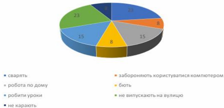
Рис.5.Результати опитування шестирічних-першокласників (хлопчиків) з питання «Засоби покарання?» у % від загальної кількості досліджуваних

Серед дівчаток на питання «Засоби покарання» (рис.6) отримано такі відповіді: «робота по дому» –21%; «виконання уроків» –19%; «сварять» –18%; «не відпускають на вулицю» –12%; «забороняють користуватися комп'ютером» –3%; «фізичні покарання» –1%. Дівчаток (26%) не карають.