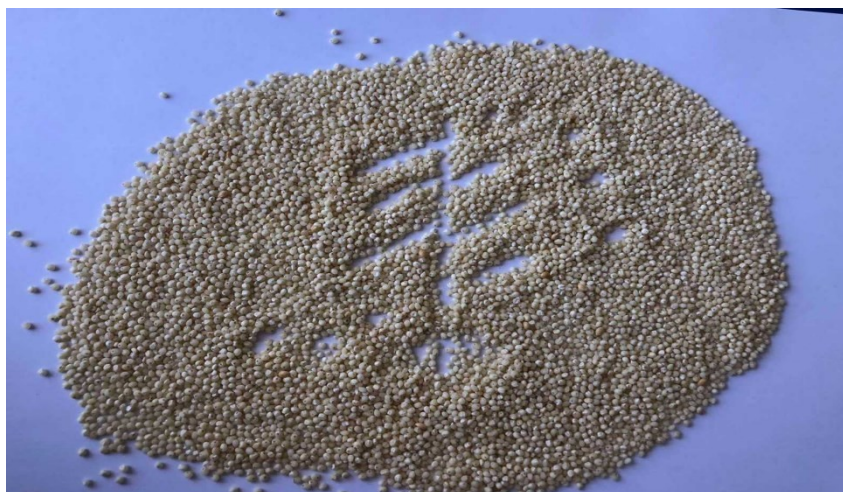
Рис. 5 Емоційний стан «тут і зараз» (робота студентки А., III курсу факультету фізичної культури та спорту)