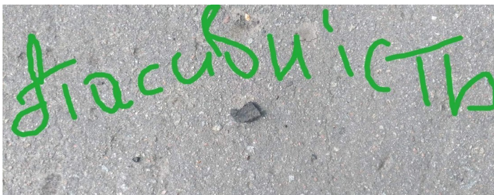
Рис. 4. Пасивність

3. Арт-екопрактика «Мій емоційний стан» – вправа передбачає роботу з пшоном.