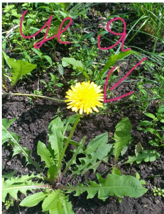
Рис. 2. Природний об'єкт з яким себе асоціює особистість (обраний об'єкт студентки Т., IV курсу факультету фізичної культури та спорту)

2. Арт-екопрактика «Активність/Пасивність» – вправа передбачає вибір природніх об'єктів, що асоціюються з різними станами особистості.