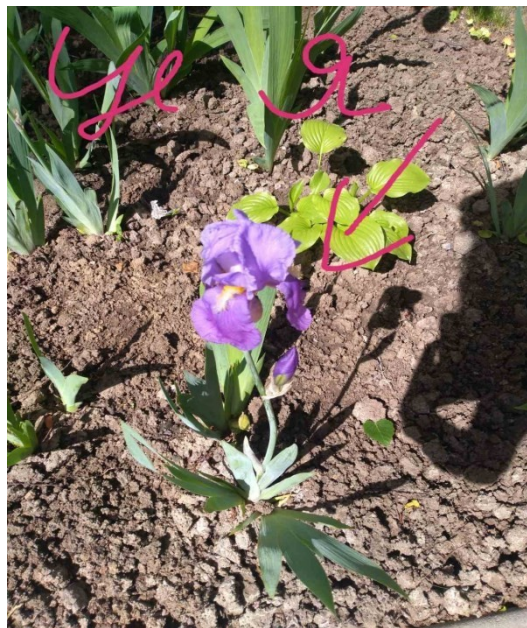
Рис. 1. Природний об'єкт з яким себе асоціює особистість (обраний об'єкт студентки К., IV курсу факультету фізичної культури та спорту)

Наприклад, серед таких об'єктів студенти обрали (див. рис. 1, 2).