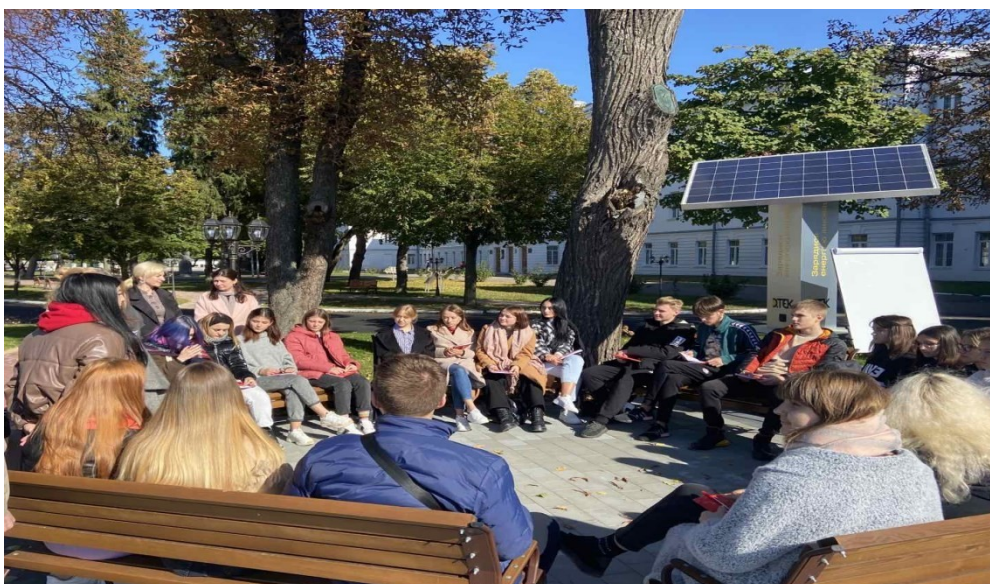
Рис. 8. Зі студентами спеціальності 053 «Психологія» на території

креативності, формування конструктивно мислячих особистостей здатних протистояти деструктивним впливам. Забезпечує умови для утвердження креативних фахівців, які прагнуть створювати нові, оригінальні продукти духовного чи матеріального значення, що можуть бути значущими для суспільства та природи. Сприяє захисту духовного, психічного, психологічного, соціального здоров'я учасників освітнього процесу. Засідання психологічної студії часто здійснюються й у «зелених аудиторіях». Наприклад, на території мультифункціонального майданчику – Алеї ДТЕК (див. рис. 7). Де є всі можливості використання арт-екопрактик під час тренінгових занять, круглих столів, тощо.