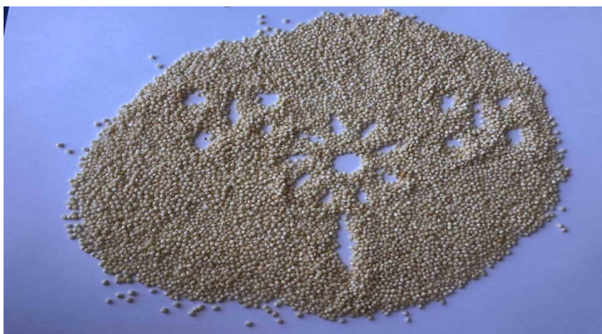
Рис. 6. Бажаний емоційний стан «завтра» (робота студентки А., III курсу факультету фізичної культури та спорту)

Також цікавою є вправа «Тематичний образ». Арт-практика, що передбачає декілька завдань, наприклад: 1) створити образ екогероїні, покликанням якої є збереження балансу в системі «людина-природа». Образ створюється з «підручних матеріалів», які є у студента (зошити, ручки, олівці, папір та ін.); 2) визначити мету та основні завдання екогероїні; 3) обґрунтувати основні напрями реалізації поставленої мети та завдань; 4) з'ясувати основні труднощі, які можуть виникати на шляху героїні та варіанти їх подолання; 5) презентувати отримані результати (групова робота).