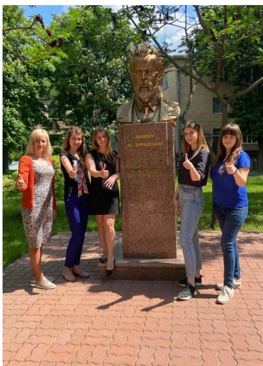
Рис. 7. Зі студентами спеціальності 227 «Фізична терапія та ерготерапія» на території Національного університету «Полтавська політехніка імені Юрія Кондратюка»

На кафедрі психології та педагогіки Національного університету «Полтавська політехніка імені Юрія Кондратюка» під час виконання студентами самостійних робіт, підготовки творчих звітів з психології, психології здоров'я та здорового способу життя є можливість попрацювати у внутрішньому дворіку університету виконуючи ряд арт-екопрактик (див. рис. 7).