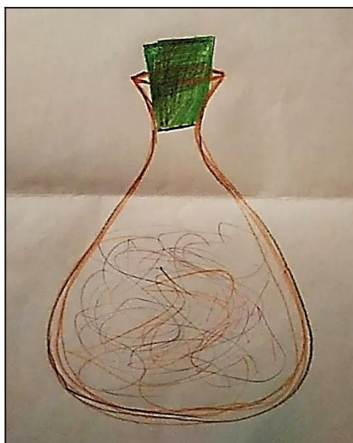
Рис. 1. Малюнок «Тату вина»