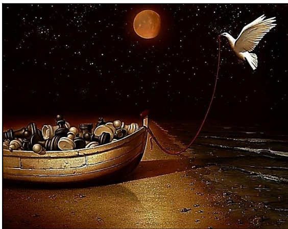
Рис. 4. З. Задемак «Голуб миру»