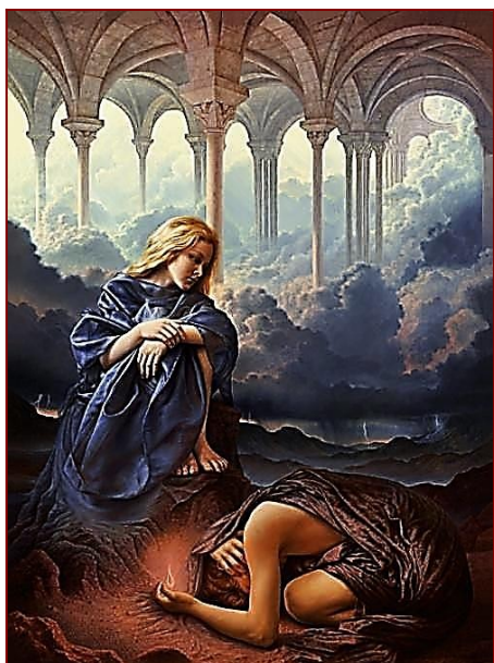
Рис. 7. Г. Сморенберг «Подарунок»

І.: Так, вірно. Це я (рис. 7, вказує на фігуру зверху), а це – він (рис. 7, фігура знизу).