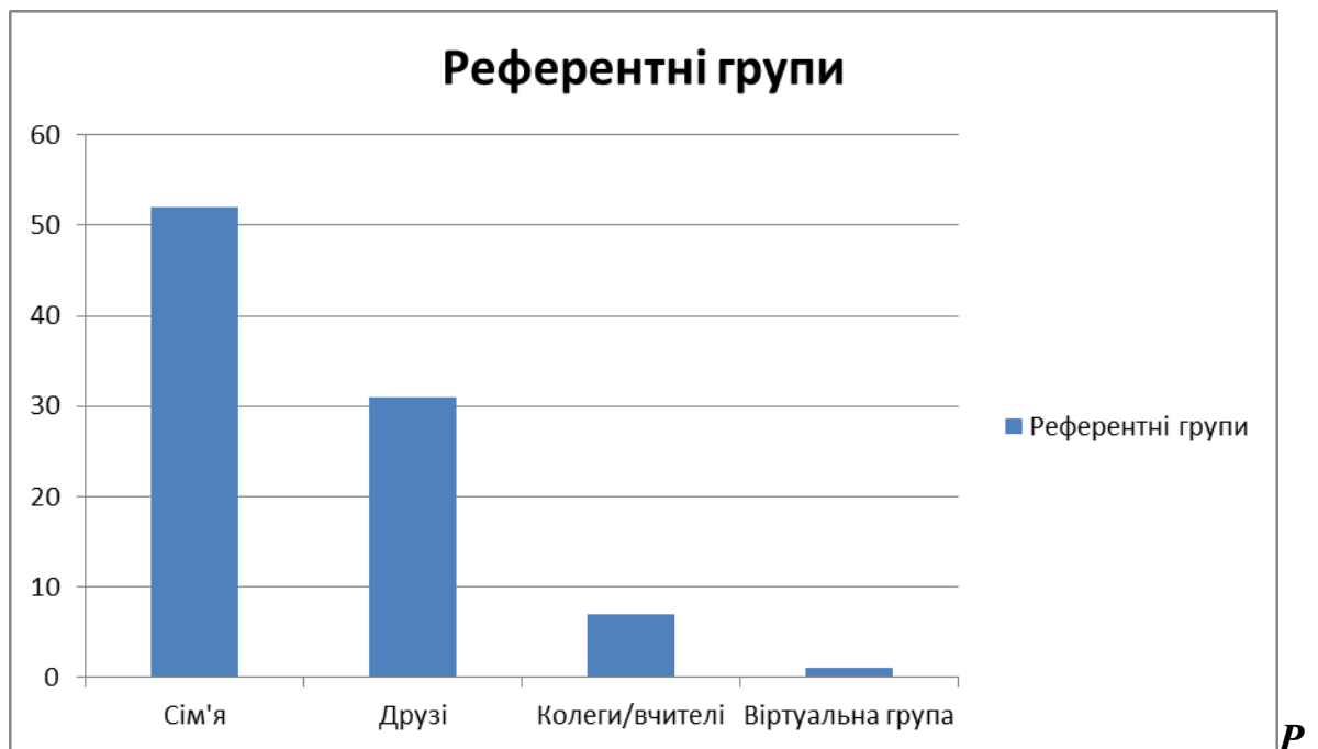
Рис. 1. Результати аналізу референтних груп

Отже, одним із завдань психосоціальної реабілітації є розширення кола спілкування, спрямування на побудову взаємовідносин не лише серед найближчого оточення, але й на інші сфери життя, де особа може знайти можливості для саморозвитку.