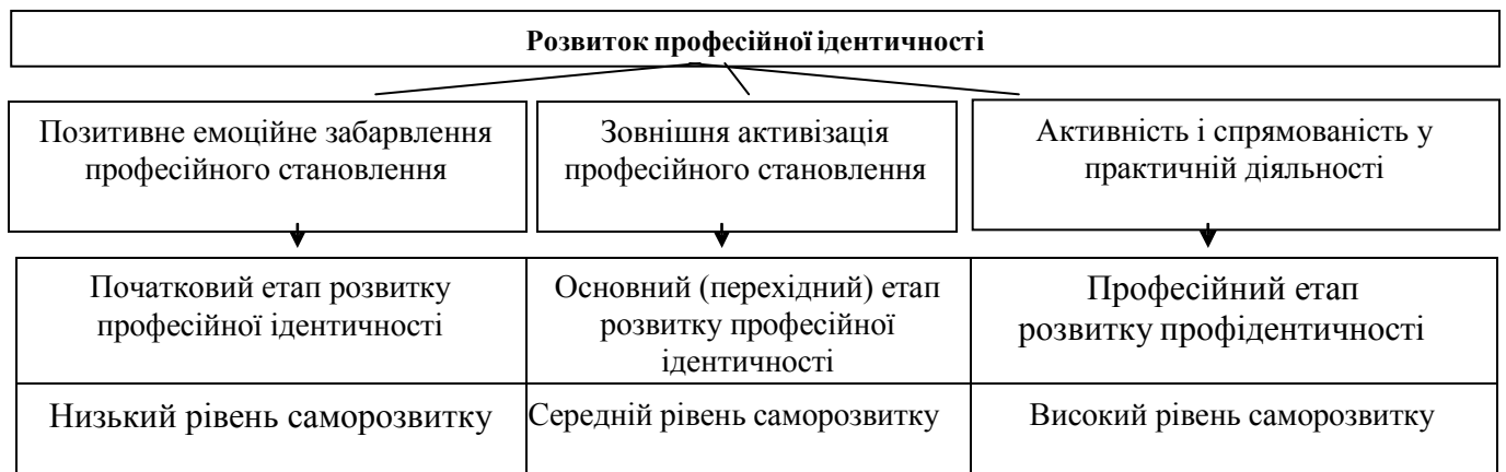
Рис. 2. Модель розвитку професійної ідентичності учнів в умовах навчання у ПТНЗ (на основі фактору саморозвитку)

На професійному етапі розвитку профіидентичності поряд із чинником активності і спрямованості в практичній діяльності знову виявляється пряма кореляція також із чинником емоційного забарвлення професійного становлення. Відмінність полягає в тому, що на початковому етапі позитивні емоції виникають від оволодіння простими робітничими навичками та вміннями, а на завершальному – від здійснення високопрофесійних, творчих дій.