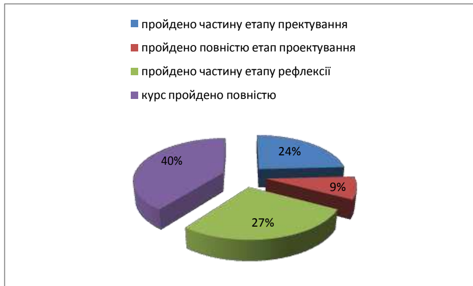
Рис.1. Статистика проходження курсу.

У попередніх дослідженнях ми виділили певні тренди відповідей учасників, щодо цілей проекту.