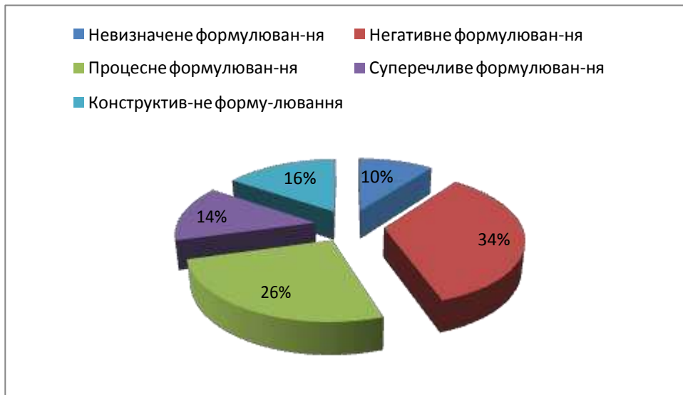
Рис.2. Особливості цілепокладання.

Кожну робочу сесію ми поверталися до визначення цілей, тому що вважаємо це найважливішим локусом проектування розвитку. Можливо, саме тому незмінними протягом курсу залишилися цілі у досить незначного відсотка учасників. Інші цілі неодноразово трансформувалися в відомих напрямках – конкретизувалися, розширялися або змінювалися взагалі на інші.