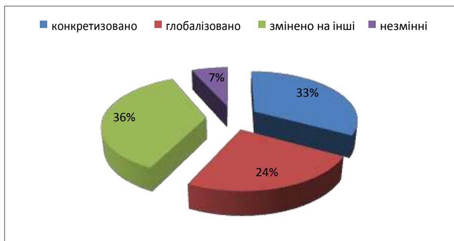
Рис.3. Характер зміни цілей протягом курсу.

Кожну робочу сесію ми поверталися до визначення цілей, тому що вважаємо це найважливішим локусом проектування розвитку. Можливо, саме тому незмінними протягом курсу залишилися цілі у досить незначного відсотка учасників. Інші цілі неодноразово трансформувалися в відомих напрямках – конкретизувалися, розширялися або змінювалися взагалі на інші.