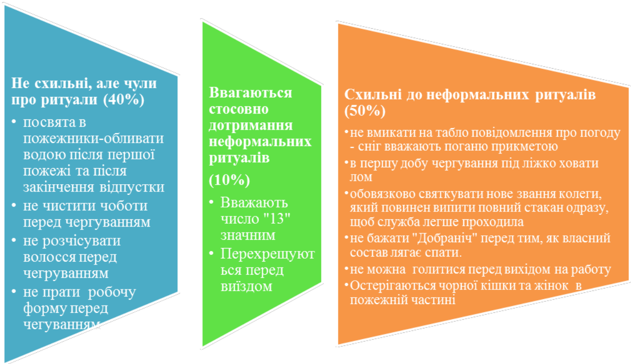
Рис. 1. Схильність до неформальних ритуалів у підрозділах МНС

За результатами методики «Матриці Равена», яка призначена для визначення рівня інтелекту особистості було виявлено, що 50% респондентів з підгрупи, що схильні до використання неформальних ритуалів мають середній рівень інтелекту на відміну від першої, респонденти якої мають рівень інтелекту вище середнього та високий рівень (див.рис.2)